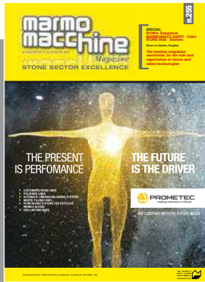
In copertina / Front cover